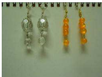
Vypredané 1.80 (dajú sa odjednat).