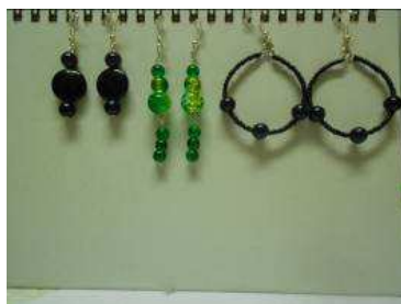
Vypredané 1.80 1.80 (dajú sa kúpiť).