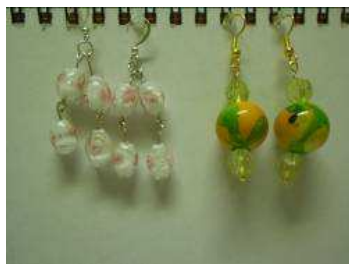
1.80 Vypredané (dajú sa kúpiť).